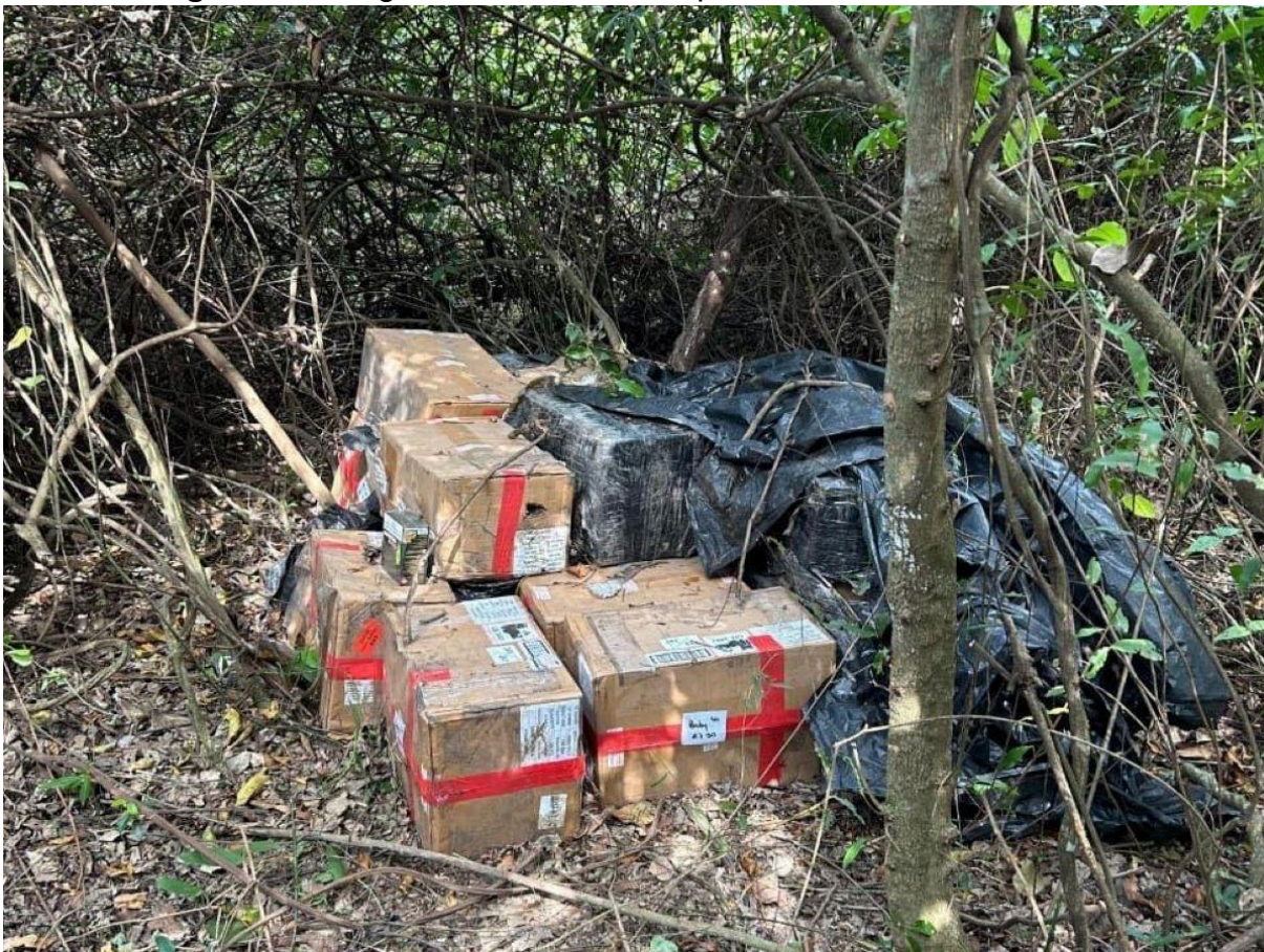
Figura 4 – Carga escondida no Parque Nacional da Ilha Grande

Além disso, a cobertura da copa das árvores inviabiliza a leitura de imagens aéreas captadas por drones.