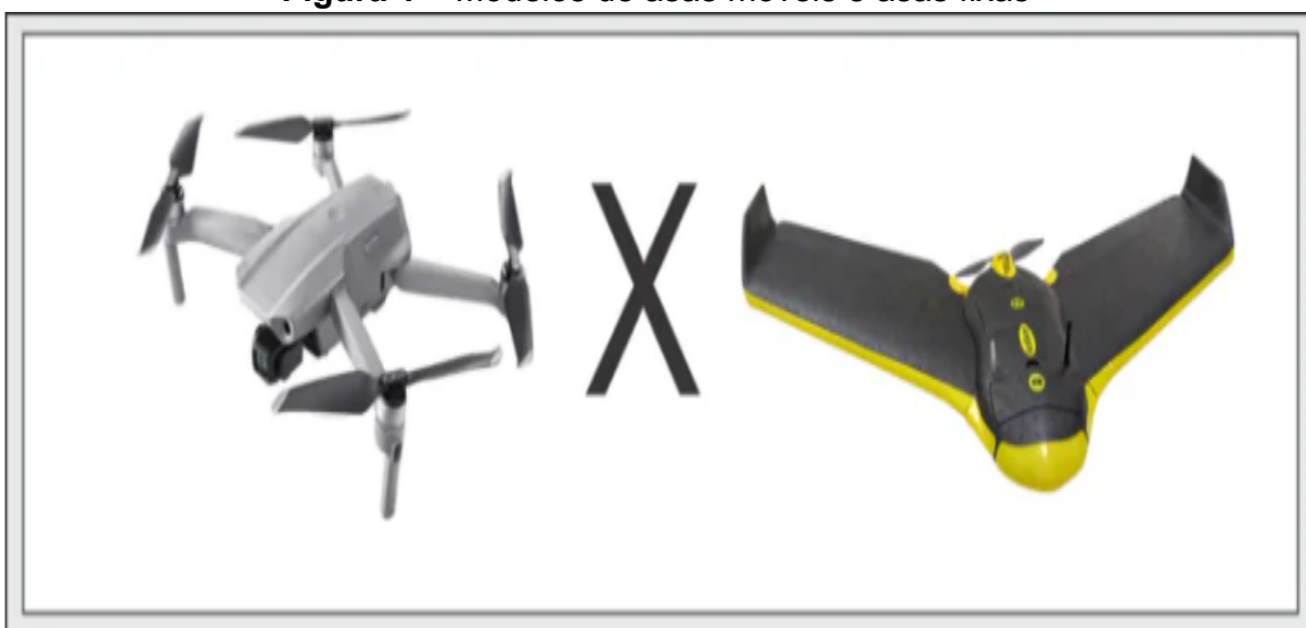
Figura 1 – Modelos de asas móveis e asas fixas

Uma das classificações dos SARP é quanto ao tipo de voo: os de asas fixas que se assemelham a aviões, são recomendados para voos em altitudes elevadas; e os de asas móveis ou rotativas conhecidos por multirotores, voam mais lentamente, em altitudes mais baixas, com pouso e decolagem na vertical, conforme ilustrado na Figura 1.