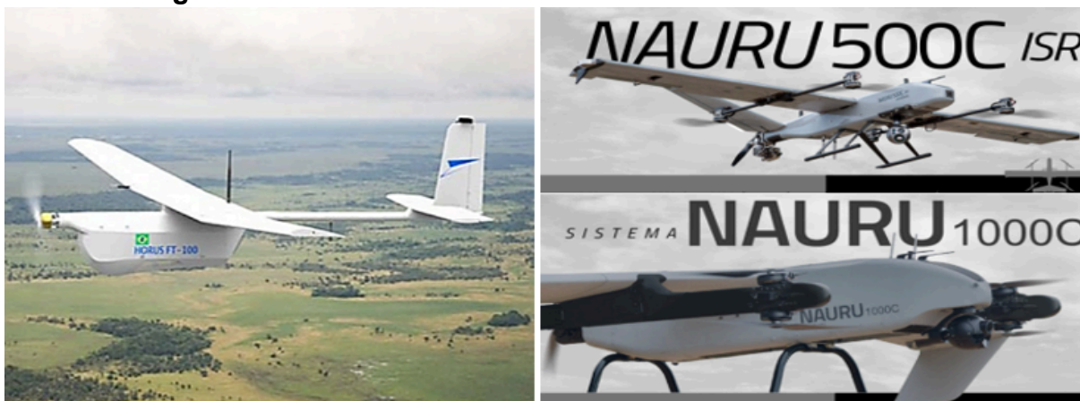
Figura 3 - Drones modelo FT-100 Horus e Nauru 500C/1000C